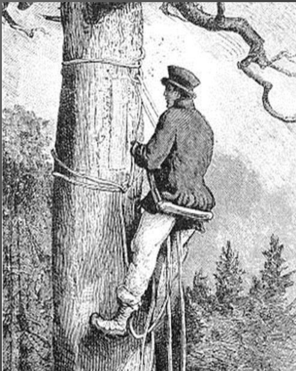
Bartnik na tzw. leziwie