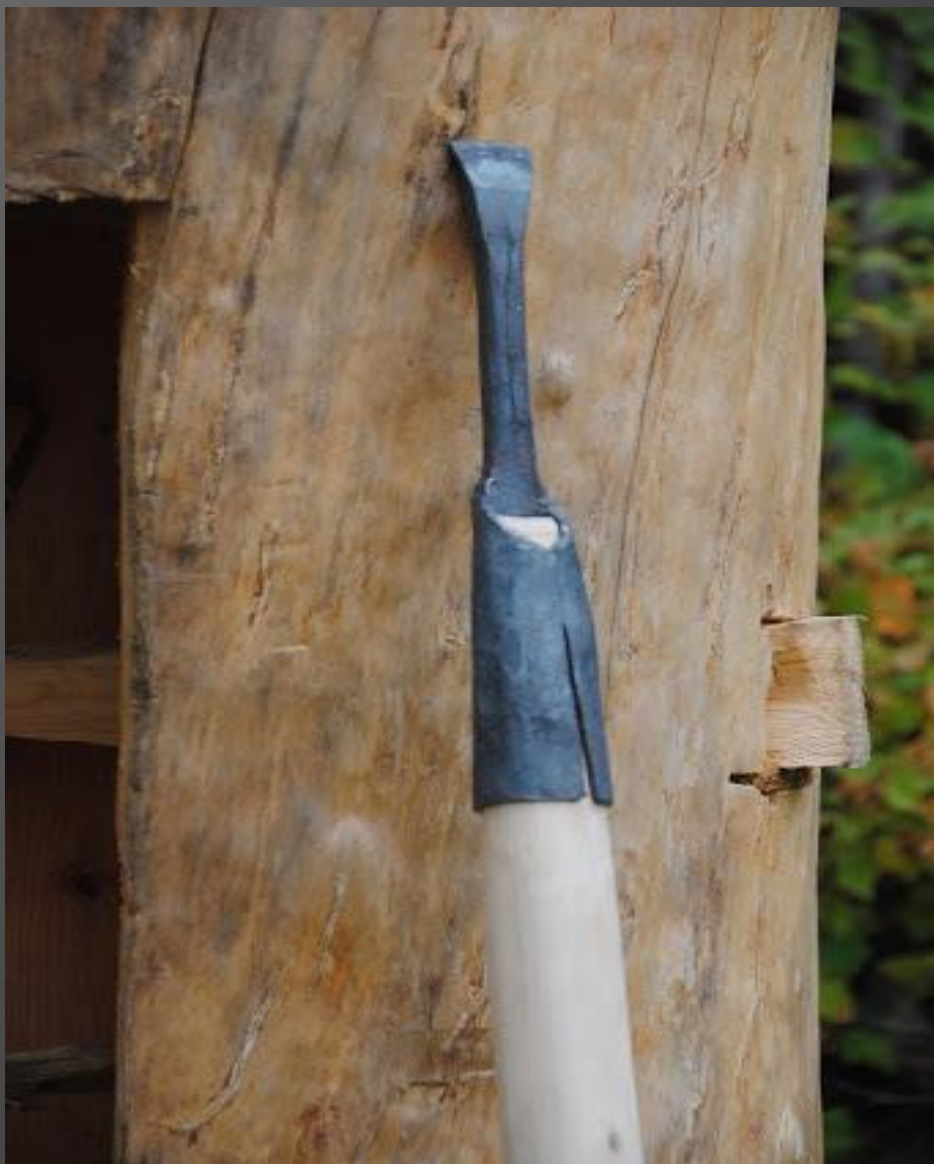
Piesznia do dziania barci