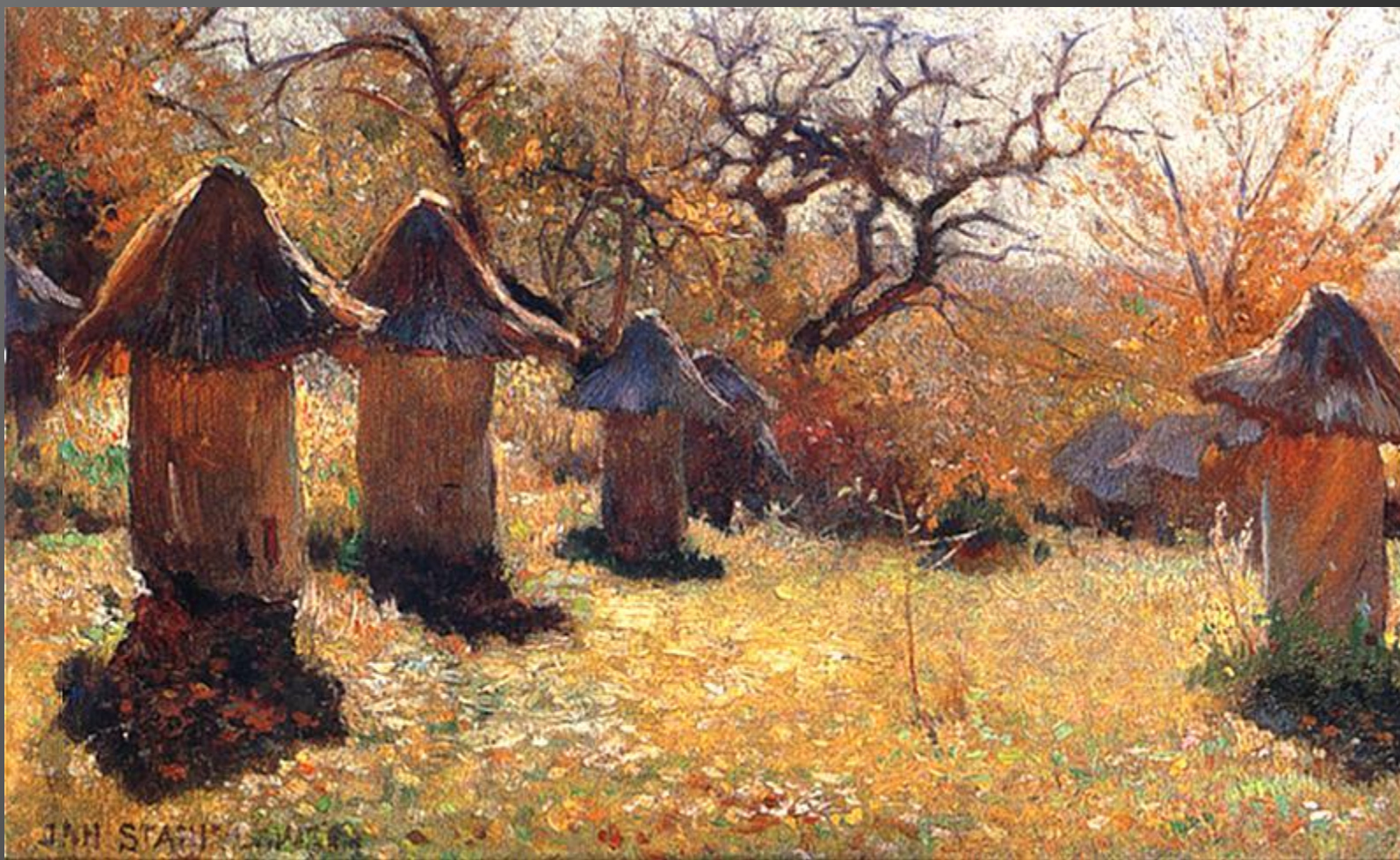
Jan Stanisławski, „Ule na Ukrainie” (ze zbiorów Muzeum Narodowego w Krakowie)