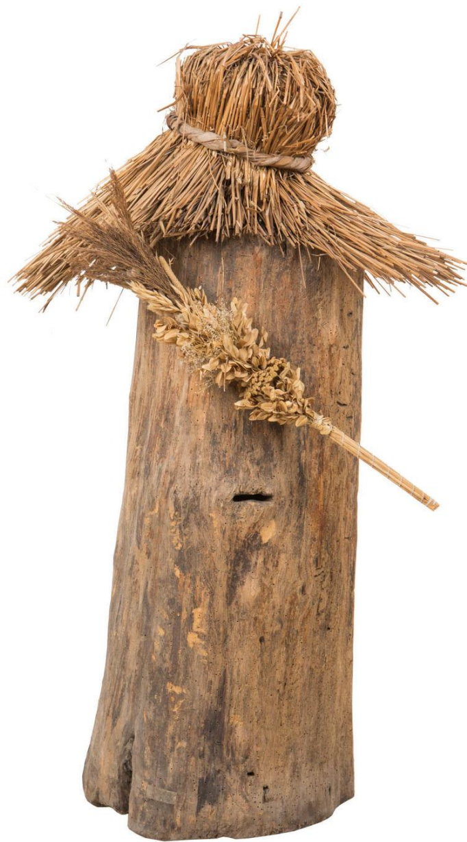
Ul kłodowy pionowy (Muzeum Regionalne w Krasnymstawie)