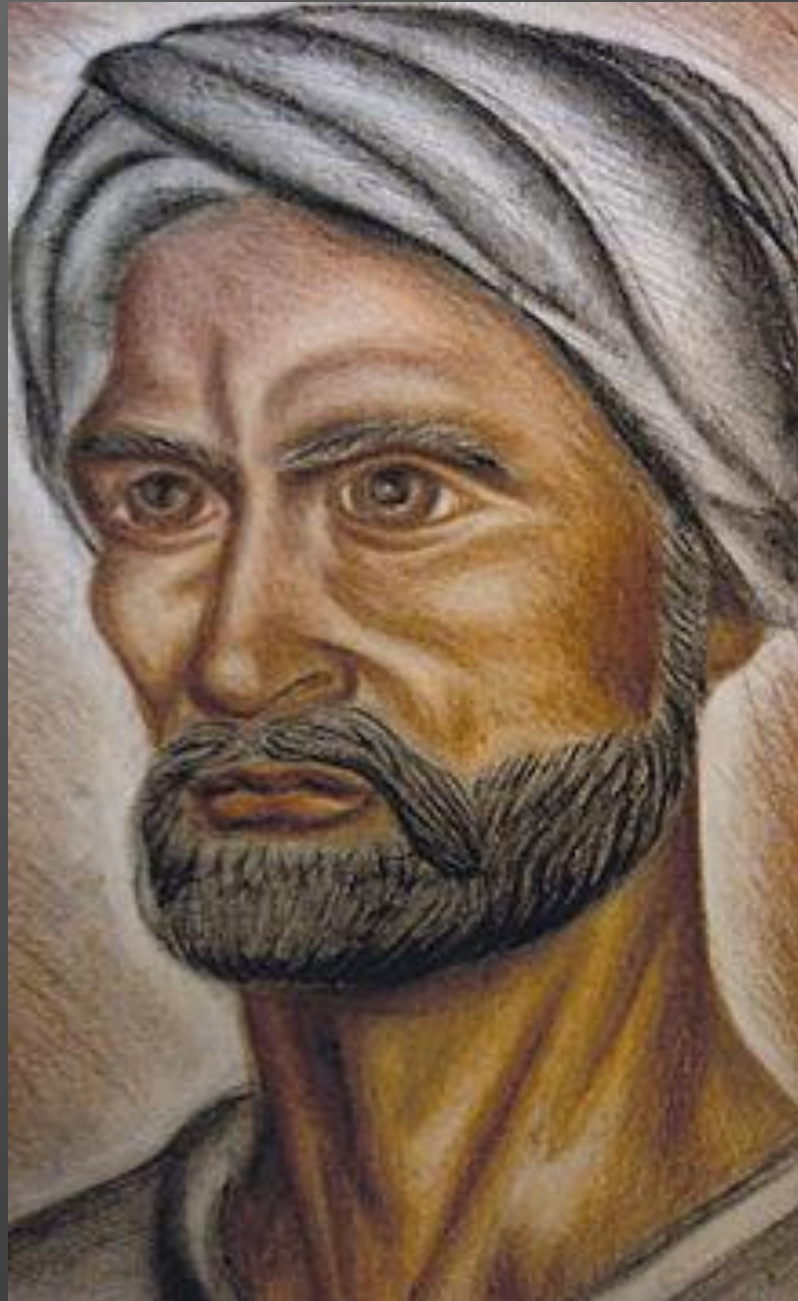
Ibrahim ibn Rosteh