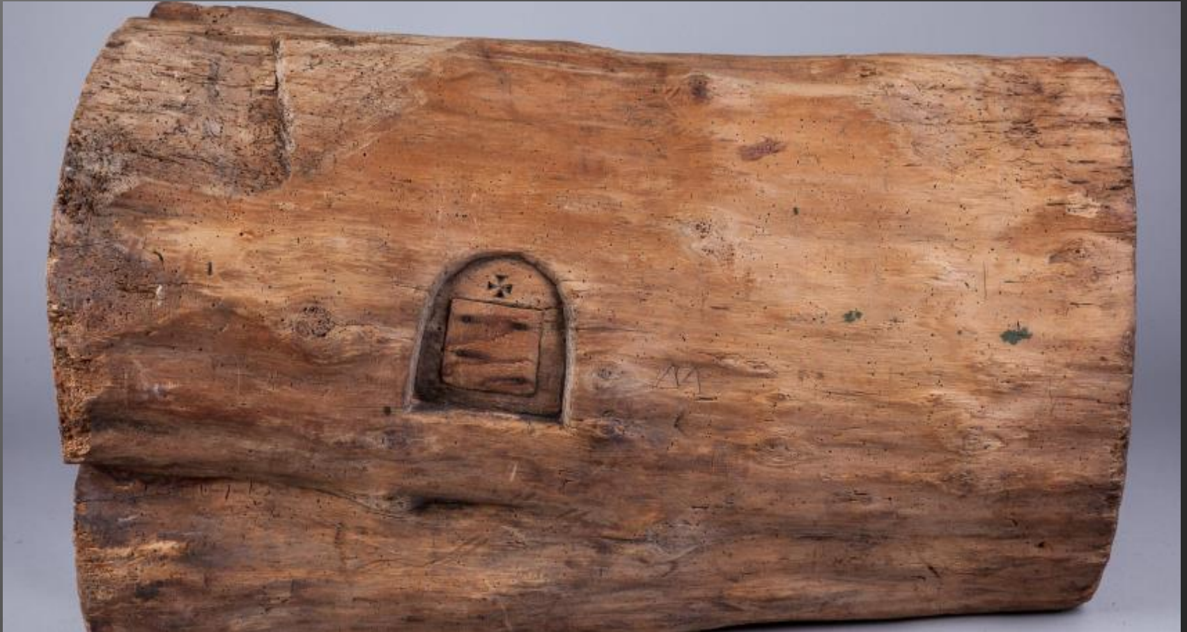
Kłoda bartna pozioma ze zbiorów Muzeum Etnograficznego w Krakowie