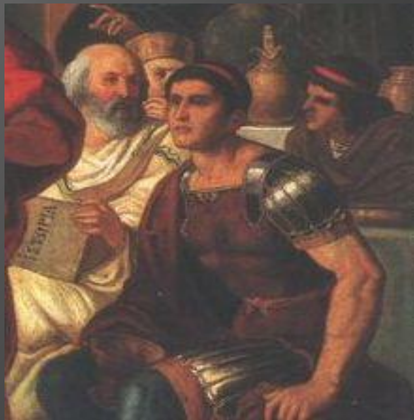
Priskos z Panion