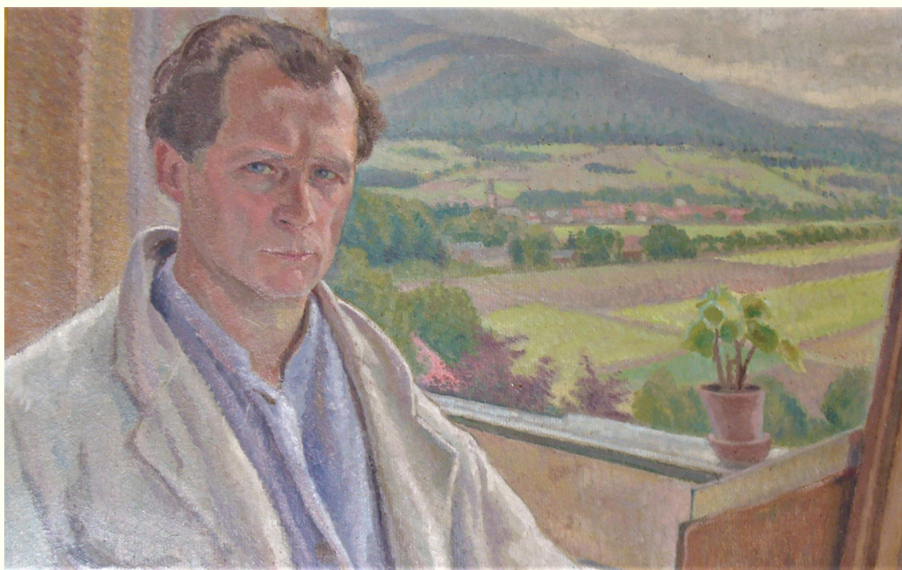
Antoni Teslar Autoportret w ręcznym lusterku olej na płótnie, 1946 rok

Antoni Teslar, pejzażysta, portrecista, emalier, jubiler, projektant, zmarł w Warszawie 13 września 1972 roku, w Szpitalu Dzieciątka Jezus przy ul. Lindleya. Został pochowany na Cmentarzu Wojskowym na warszawskich Powązkach.